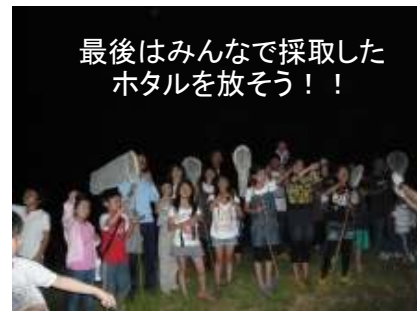
最後はみんなで採取した ホタルを放そう!!