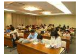
センターに戻って 今日のまとめ!!

自然体験講座『 蛍 の学習と観察』を開催しました!! 今回大人・子供を合わせて 42 名の参加者が集まりました。当初、湯涌温泉界隈での ホタル 観察の予定でしたが、 環境の変化 などで思っていたより ホタル を見つけることができませんでした。