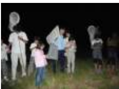
みんなでホタル探し