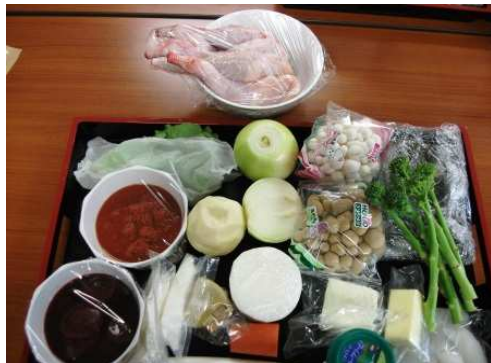
↑今回使用した食材