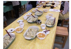
受講生の完成料理 ↑

今回の親子で料理教室『中国・西安のギョウザ作り体験』は、 New講座 です!! 今回挑戦した料理は、こちらです ↓