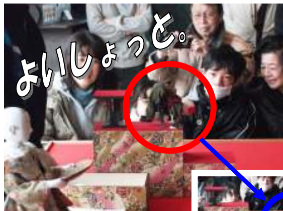
ユニークな人形もいます!