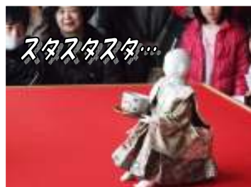
ひたすらお茶を運び続ける...