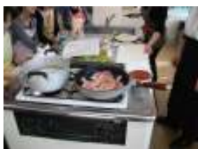
軽く焼き色をつける!!