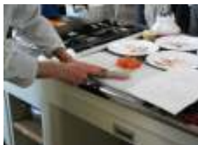
サワラを薄くそぎ切りにし盛り付ける★