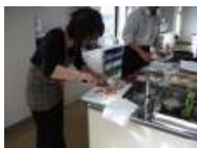
鶏足の下ごしらえ中