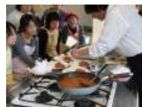
チキンのチリトマトソース煮盛り付け★