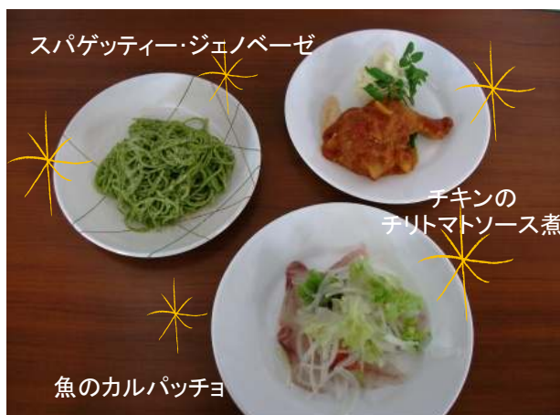
スパゲッティ・ジェノベーゼ

「思ったより簡単につくれた!!」、「このレシピがあれば、家でも作ってみたい!!」と参加者の皆様からの声を頂きました☆レシピも載っているので、参考にご覧下さい(^-^)/v