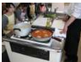
玉ねぎやホールトマトを入れたフライパンで煮る