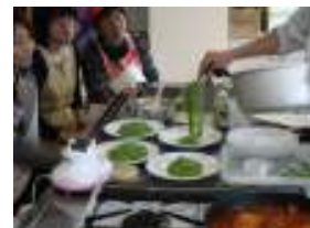
茹でた麺とソースをからめて盛り付け★