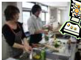
ジェノベーゼソースを作る