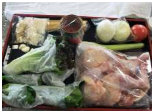
今回使う食材です!!