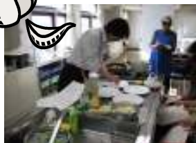
カルパッチョ用の皿にニンニクをすり込みます